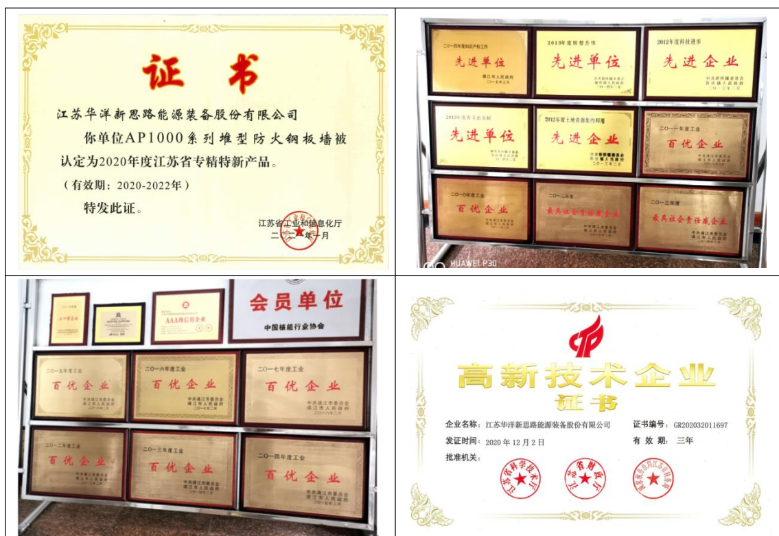
图 1-1 公司荣誉